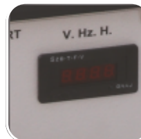
Contor ore, echipare standard pentru voltmetru si frecventa SC-5000 si SC-6000