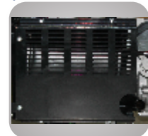
Esapament unic ce reduce zgomotul