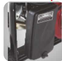
Filtru de aer patentat