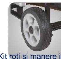
Kit roti si manere in