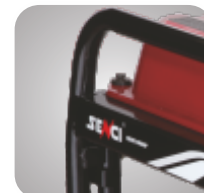
Cadru tratat pentru a preveni ruginirea